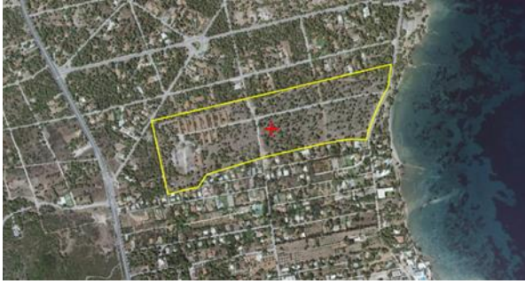
Εικόνα 1: Απεικόνιση θέσης ΚΑΕΚ στο Δήμο Μαραθώνα.